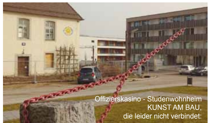
Offizierskasino - Studentenwohnheim KUNST AM BAU, die leider nicht verbindet:

Die Regensburger Sozialen Initiativen anerkennen das Bemühen der Oberbürgermeisterin, Ersatzraum im Nibelungen-Areal anzubieten, sind aber wie der Architekturkreis der Meinung, dass dadurch kein lebendiges Bürgerhaus ersetzt werden kann. Darauf wurden mit Recht viele Hoffnungen gesetzt und in der ersten Planungsphase ja auch berücksichtigt, so dass jetzt alles unternommen werden sollte, kreative Lösungen zu verwirklichen. Es darf nicht sein, dass aufgrund eines Planungsfehlers der Stadtverwaltung das langjährige Engagement des Bürgervereins Südost ausgebremst wird. Deshalb haben die Sozialen Initiativen auch eine Petition unterstützt und diese in der Februarausgabe des DONAUSTRUDL abgedruckt: "Die Hoffnung stirbt zuletzt!" und mit gemeinsamer Anstrengung sollten jetzt alle Möglichkeiten zugunsten einer soziokulturellen Nutzung des ehemaligen Kasinos durchgespielt werden. Die Sozialen würden sich dabei gerne zum Beispiel mit ihrem Helferkreisprojekt "Ein Sofa für jeden Stadtteil" beteiligen. Mit Stand 22. Februar gabs übrigens immerhin 650 Unterschriften online und 150 manuelle. Der Strudl wird weiter berichten.